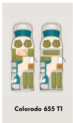
Colorado 655 TI